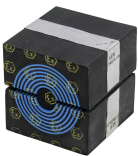
CX-Module mit Multidiameter™